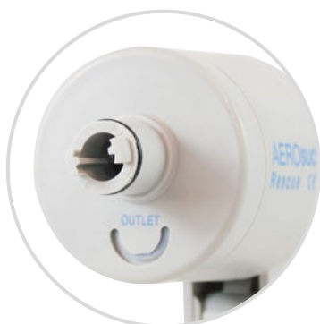
Dichtring am Pumpeneingang